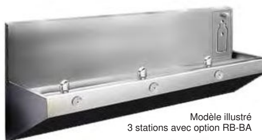
Modèle illustré 3 stations avec option RB-BA

NOUVELLE CONCEPTION CONFORME AUX NORMES SANS OBSTACLE 2015.