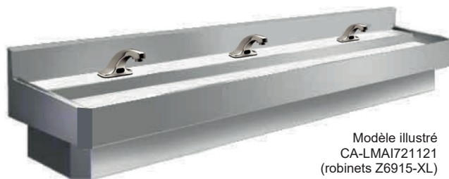
Modèle illustré CA-LMAI721121 (robinets Z6915-XL)

Lave-mains en acier inoxydable nuance 304, fini satiné #4, calibre 14, avec barre et supports de fixation murale, robinetterie manuelle ou électronique (voir ci-bas), renvoi de 1 1/2" Ø, coins avant à 45° et cache-siphon en acier inoxydable. Nombres de poste selon la longueur.