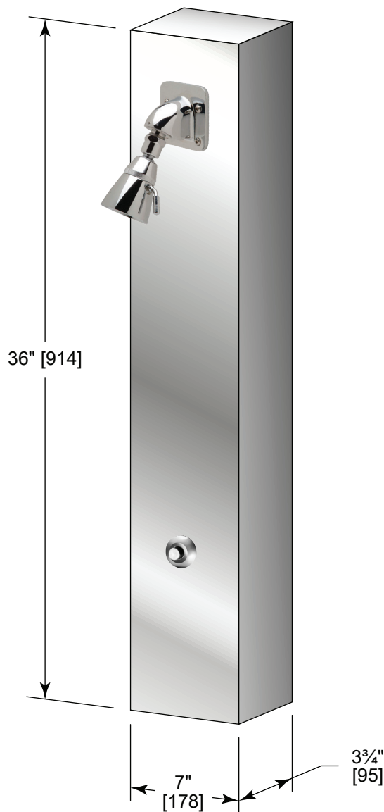
Pomme de douche Zurn Z7000-I5